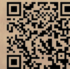
gpx navigator (per dispositivi iOS)