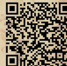
gpx viewer (per dispositivi Android)

Abbiamo testato per voi e sono qui scaricabili due app per la gestione di tracce .gpx: