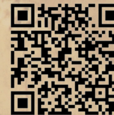
Percorsi di Storia e Ricettività (traccia .gpx)

Oltre all'anteprima del percorso inclusa in questa guida, è possibile scaricare l'intera traccia con tutte le tappe e attività commerciali in formato .gpx da utilizzare con la maggior parte dei navigatori gps e app dedicate per smartphone: